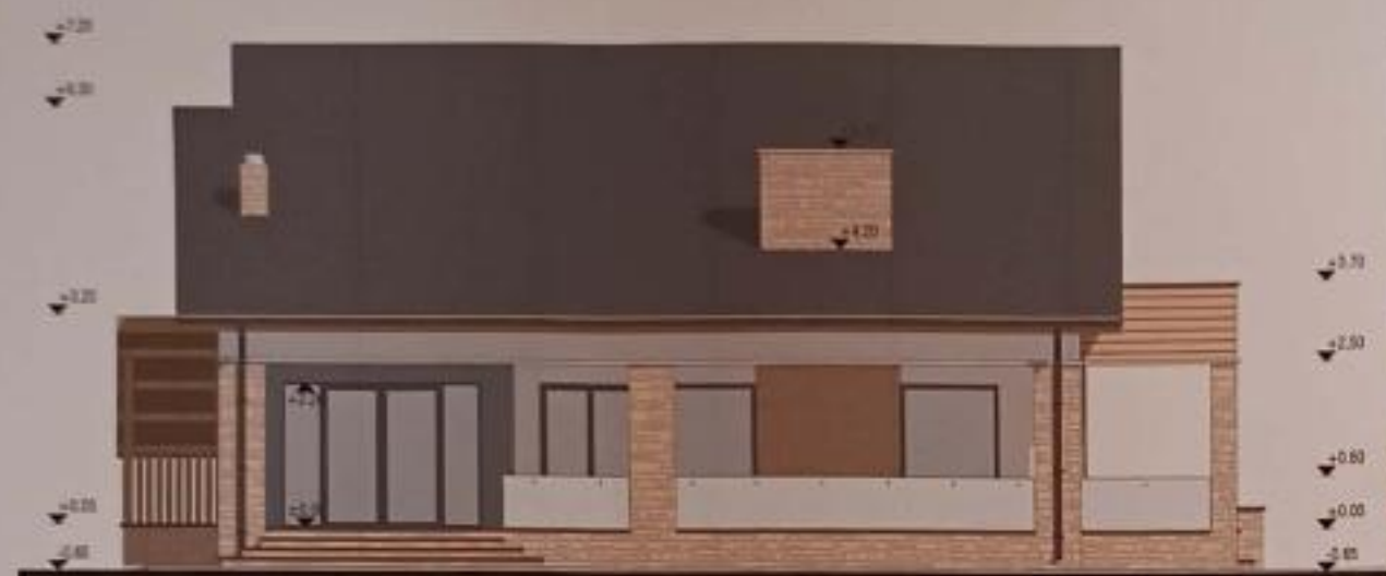
FATADA EST (LATERAL STANGA)