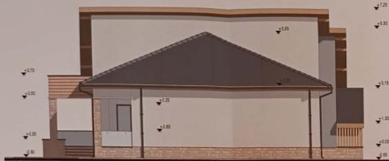
FATADA VEST (LATERAL DREAPTA)