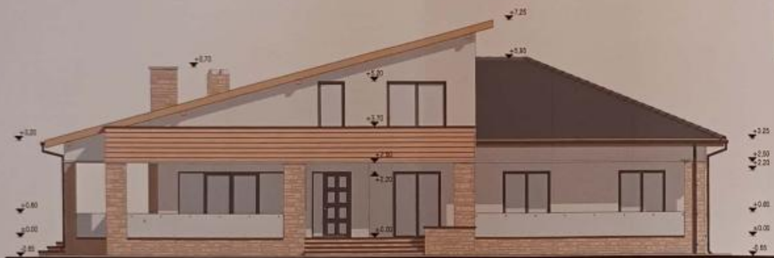
FATADA SUD (PRINCIPALA)

Clasa de importanta si expunere = „IV” conform P100-1/2013 Categoria de importanta = „D” conform HG nr. 766/1997